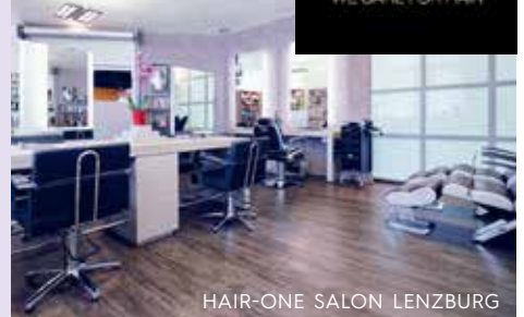
HAIR-ONE SALON LENZBURG